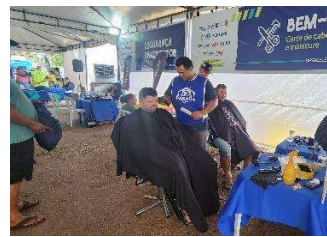
Figura 15 - Corte de cabelo