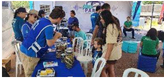
Figura 11 - Apresentação de curiosidades pelos parceiros