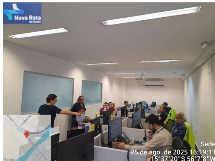
Figura 25 - Diálogo de Sustentabilidade: Impactos das Queimadas e Cuidados com Resíduos

Na sequência, foi realizado um outro Diálogo de Sustentabilidade na Sede da Nova Rota, desta vez conduzido pela equipe de Meio Ambiente, que abordou os riscos das queimadas para o meio ambiente e a importância de evitar o descarte inadequado de resíduos às margens das rodovias.