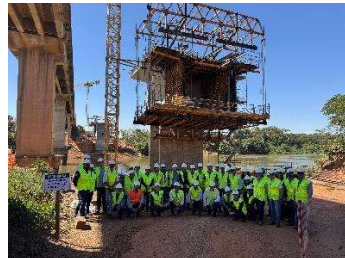
Figura 2 - Visitas às obras da nova ponte sobre o Rio Cuiabá