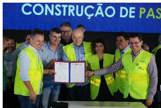
Figura 8 - Autoridades assinam as ordens de serviço