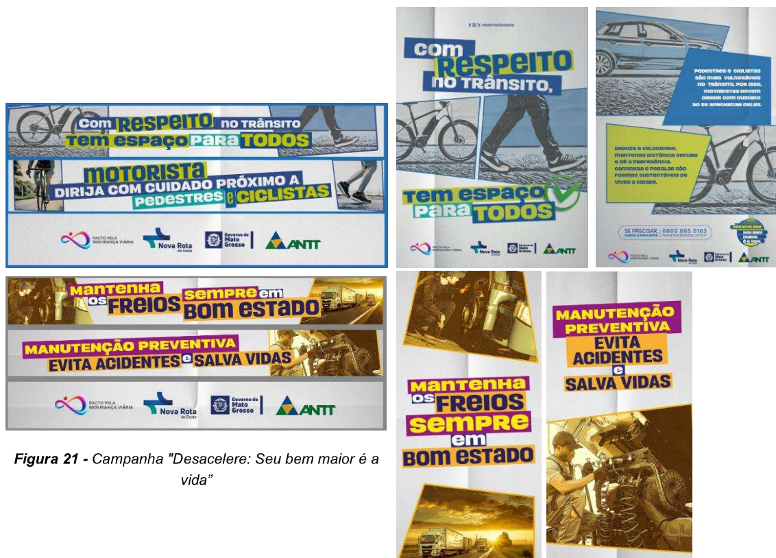
Figura 21 - Campanha "Desacelere: Seu bem maior é a vida"