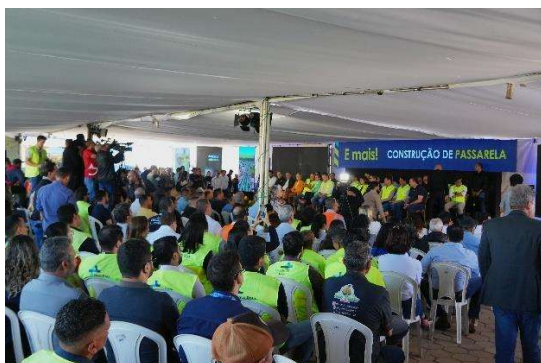
Figura 7 - Evento reuniu a sociedade

Durante o evento com a comunidade o governador Mauro Mendes destacou que a duplicação da BR-163 impacta mais de 90% da população mato-grossense. Por isso, o Governo do Estado já investiu R$ 2,3 bilhões para tornar essa obra realidade — atualmente considerada a maior obra de infraestrutura em andamento no país.