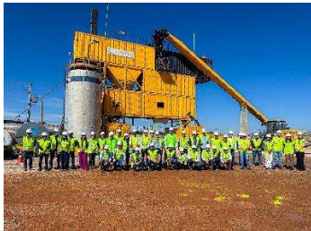
Figura 1 - Visita às obras da duplicação da Rodovia dos Imigrantes