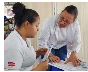
Figura 16 - Orientação nutricional