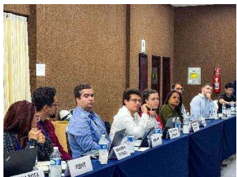
Figura 4 - Apresentações