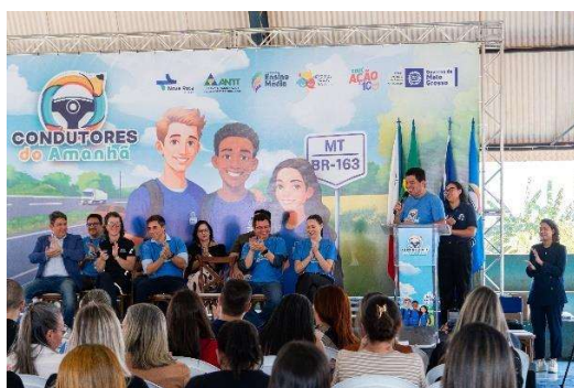
Figura 19 - Evento de lançamento