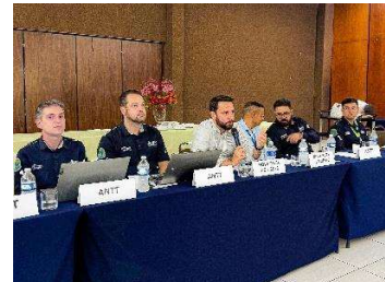
Figura 3 - Reunião da Comissão Tripartite