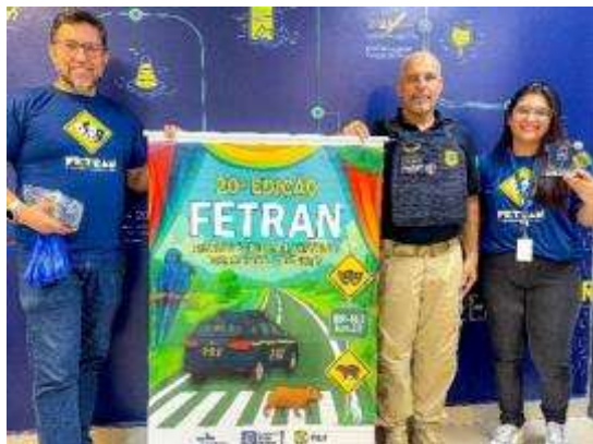
Figura 9 - Entrega de banners, troféus e medalhas