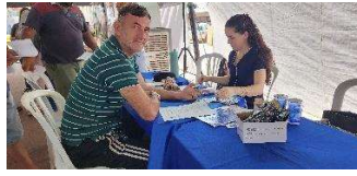
Figura 12 - Teste de glicemia