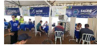
Figura 13 - Apoio emocional do CVV e testes rápidos de ISTs