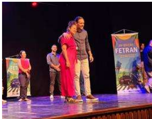
Figura 10 - Primeiro evento em Primavera do Leste - MT