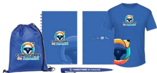
Figura 17 - Kit escolar: Mochila, caderno, caneta e uniforme