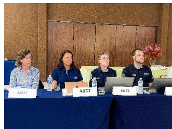
Figura 5 - ANTT