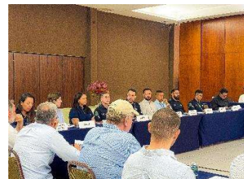
Figura 6 - Debate