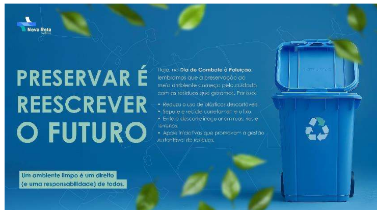
Figura 23 - Comunicado Interno: Dia do Combate à Poluição

Em agosto, foi realizada uma ação de sensibilização interna em alusão ao Dia do Combate à Poluição, incentivando os integrantes a adotarem atitudes simples no dia a dia para reduzir os impactos ambientais, especialmente no que diz respeito à geração de resíduos.