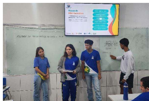
Figura 20 - Apresentação de trabalho em grupo