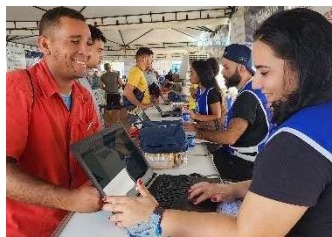
Figura 14 - Ouvidoria itinerante da Nova Rota do Oeste em contato com o usuário