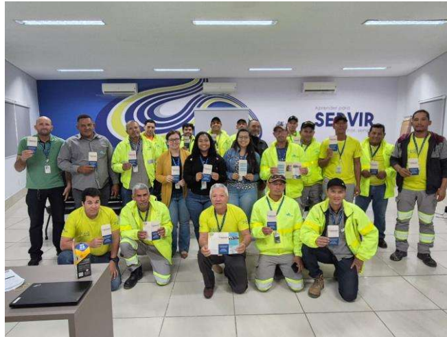
Figura 24 - Treinamento com a Equipe de Obras

Comentário de Desempenho 3T25 – Concessionária Nova Rota do Oeste