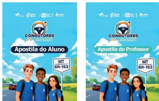
Figura 18 - Apostilas do aluno e do professor